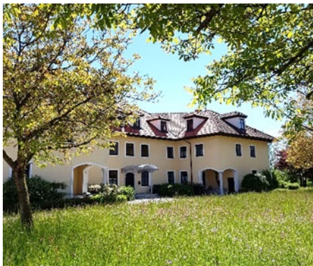
Haus der Besinnung, Gaubing

Haus der Besinnung Gaubing Gaubing 2, 4633 Gaubing