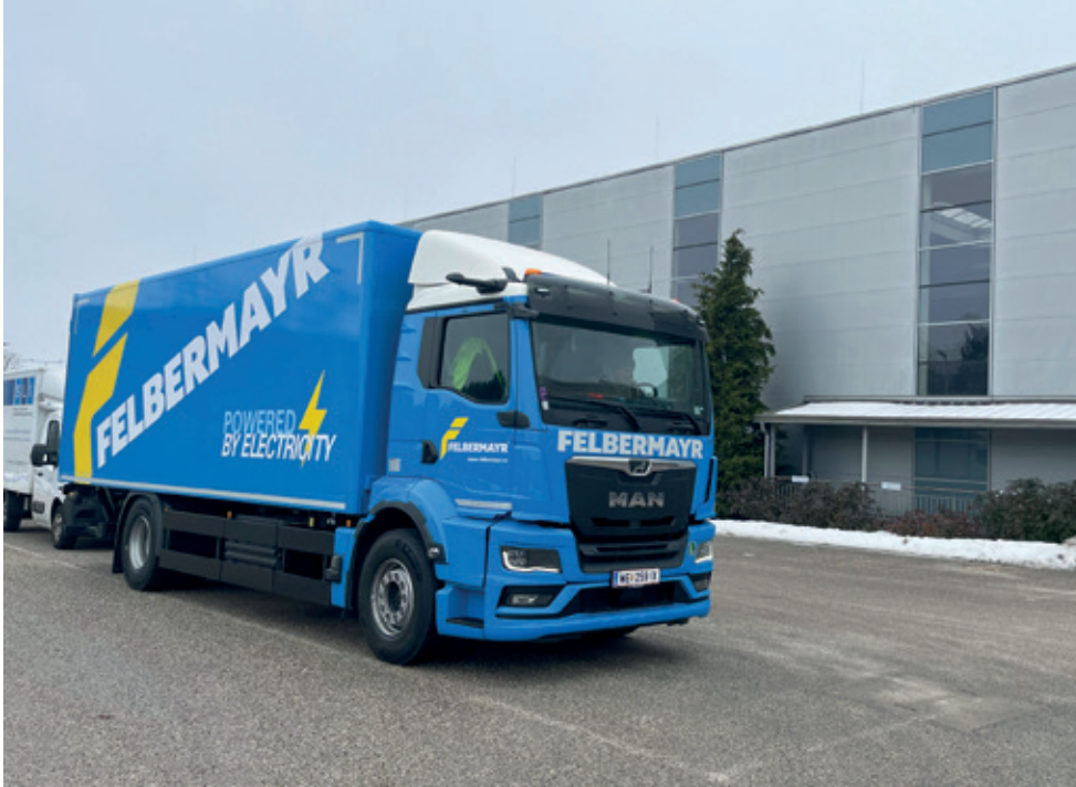
Der Lkw der Firma Felbermayr fährt elektrisch und liefert die Wäsche für Med&Tex aus.